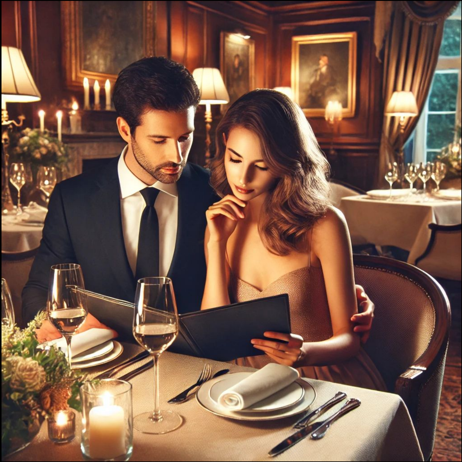
Imagem gerada por IA