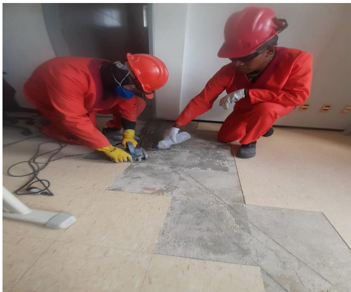
CORTE PARA A RECUPERAÇÃO DE PISO 7º ANDAR