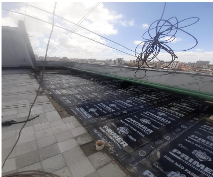
TESTE PARA A MANTA DE PROTEÇÃO MECÂNICA PISO COBERTURA