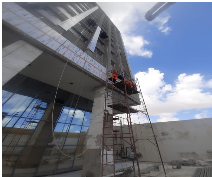
INSTALAÇÃO DA ESTRUTURA EM ACM NA FACHADA NORTE