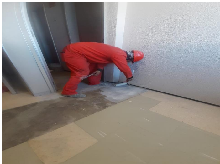
INSTALAÇÃO DO PISO PAVIFLEX NO MEZANINO