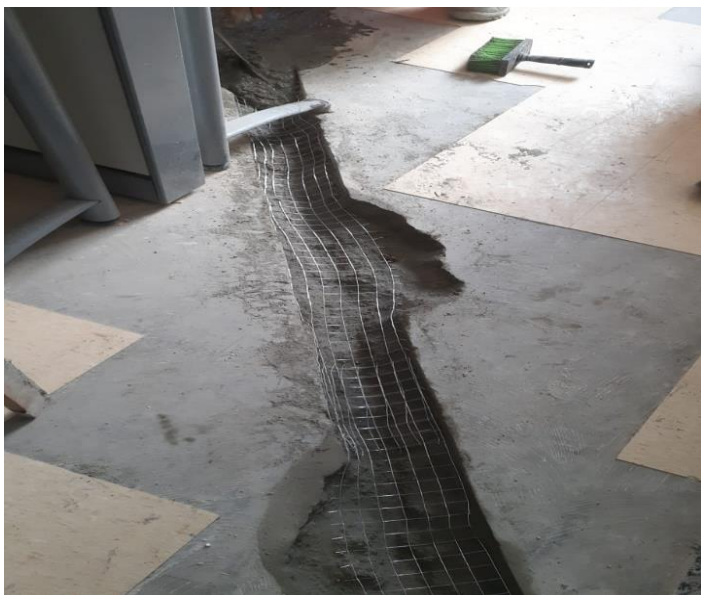
INSTALAÇÃO DA TELA DE AÇO PARA A RECUPERAÇÃO DE PISO 1º ANDAR