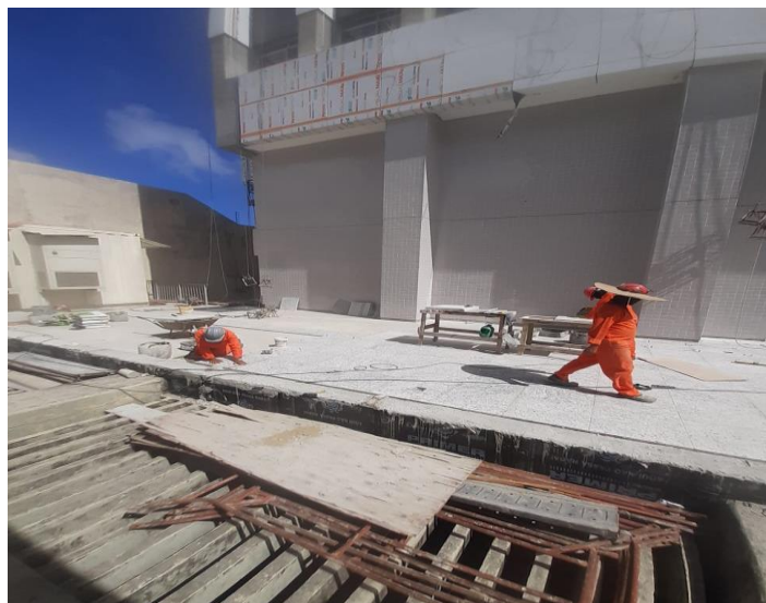
ASSENTAMENTO DE PEÇAS EM GRANITO NO PISO SUL