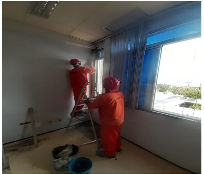
EMASSAMENTO E TEXTURA EM PAREDE 2º ANDAR