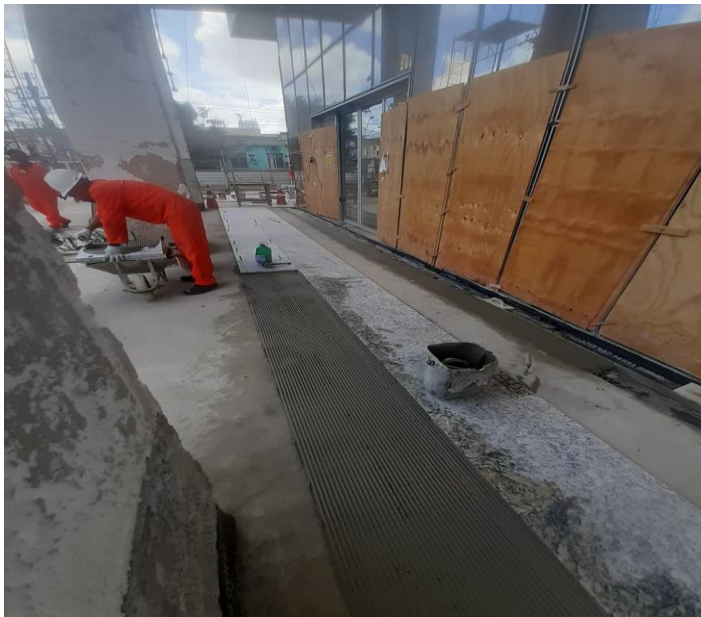
ASSENTAMENTO DO PISO EM GRANITO NO HALL