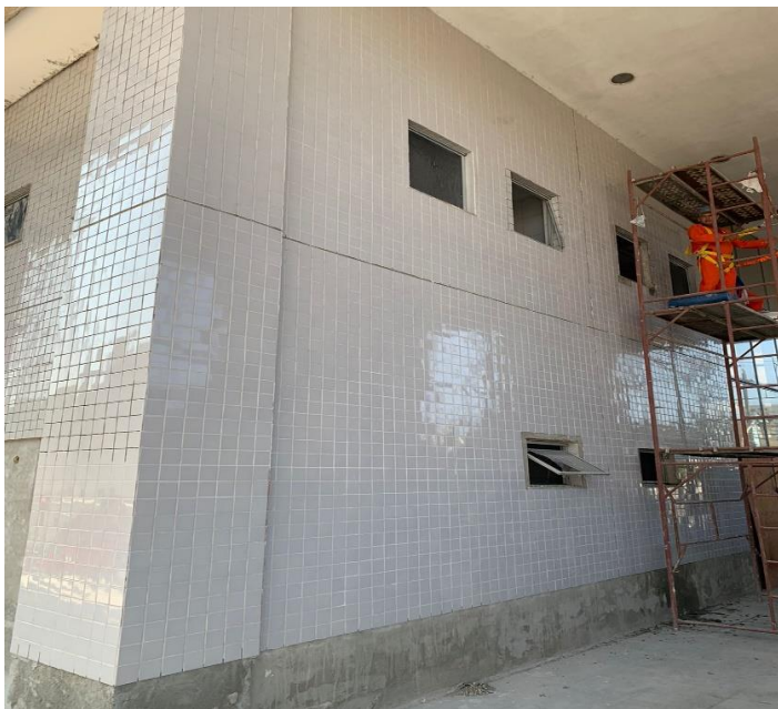
ASSENTAMENTO DO REVESTIMENTO NA FACHADA LESTE