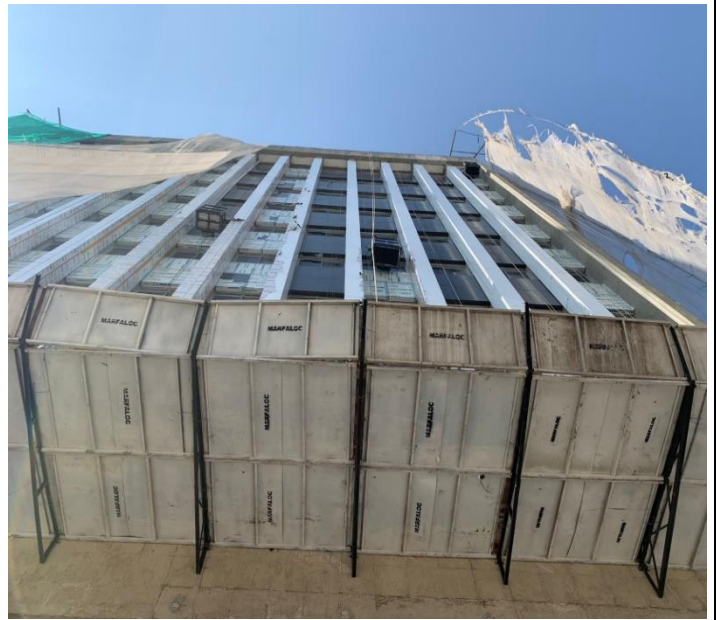
INSTALAÇÃO DE ACM NA FACHADA SUL