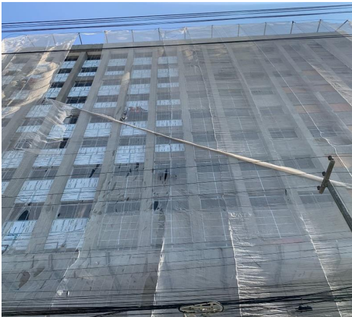
INSTALAÇÃO DE ACM NA FACHADA NORTE