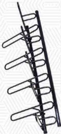
AL - 90