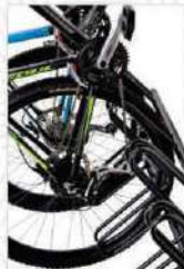
AL - 43 AL - 43G