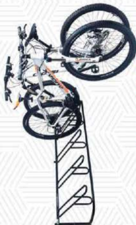
AL - 88