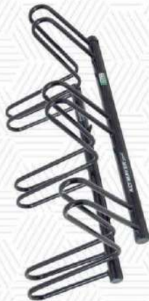
AL - 115 AL - 115G