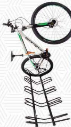
AL - 22