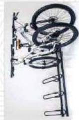
AL - 89 AL - 89G