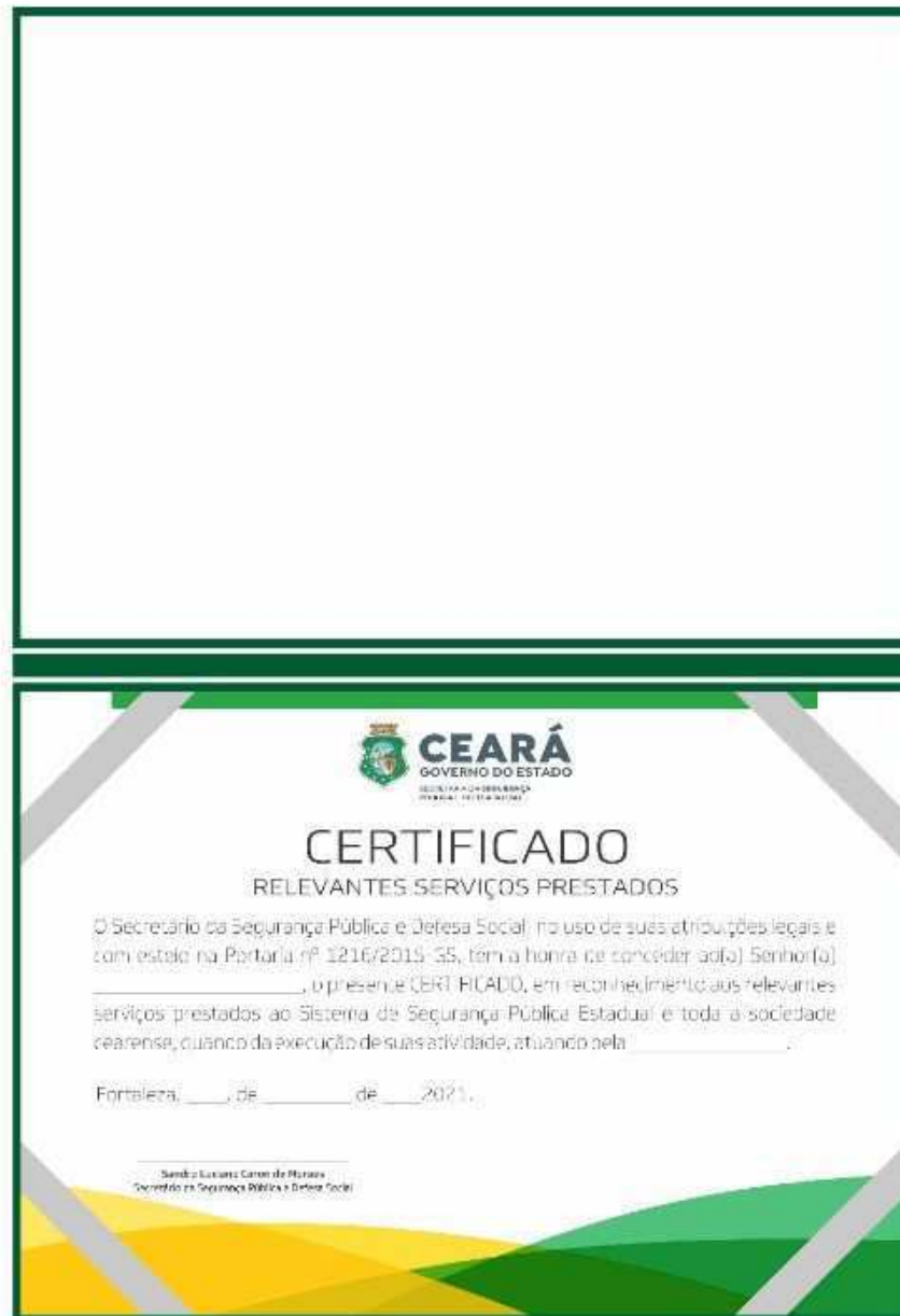
Layout Verso da Capa com Diplomas dos dois lados

LAYOUT DE PASTA Kiver - Comércio de Suprimentos