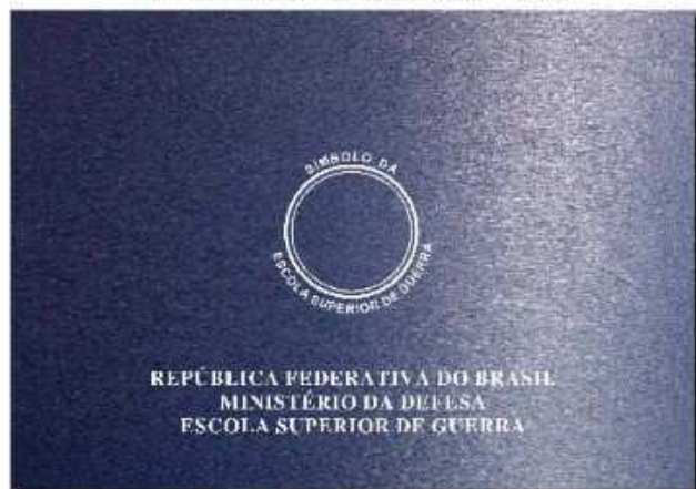
Layout Frente Fechado da Capa Personalizada

Pasta Encadernad em Couro Sintético AÇO ESCOVADO Azul Marinho Gravação em HOT-STAMPING Prata