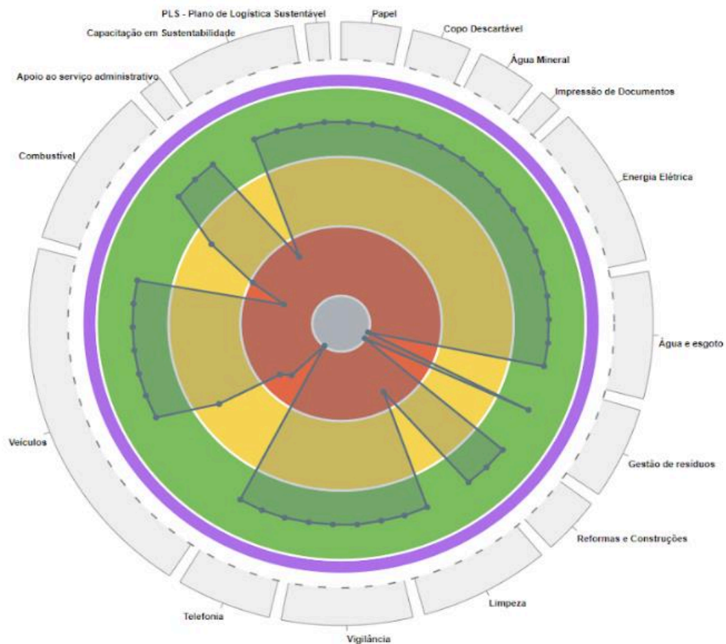
GRÁFICO EVOLUÇÃO INDICADORES DO PLS/TRT7/CE - EXERCÍCIO DE 2023