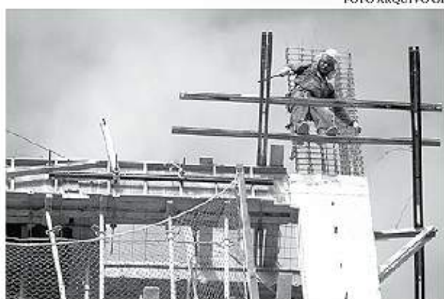
A construção civil é um dos segmentos que mais registram acidentes e doenças relacionadas ao trabalho no País

Para mudar essa realidade, o TRT/CE em parceria com Sinduscon-CE e mais 40 ins-