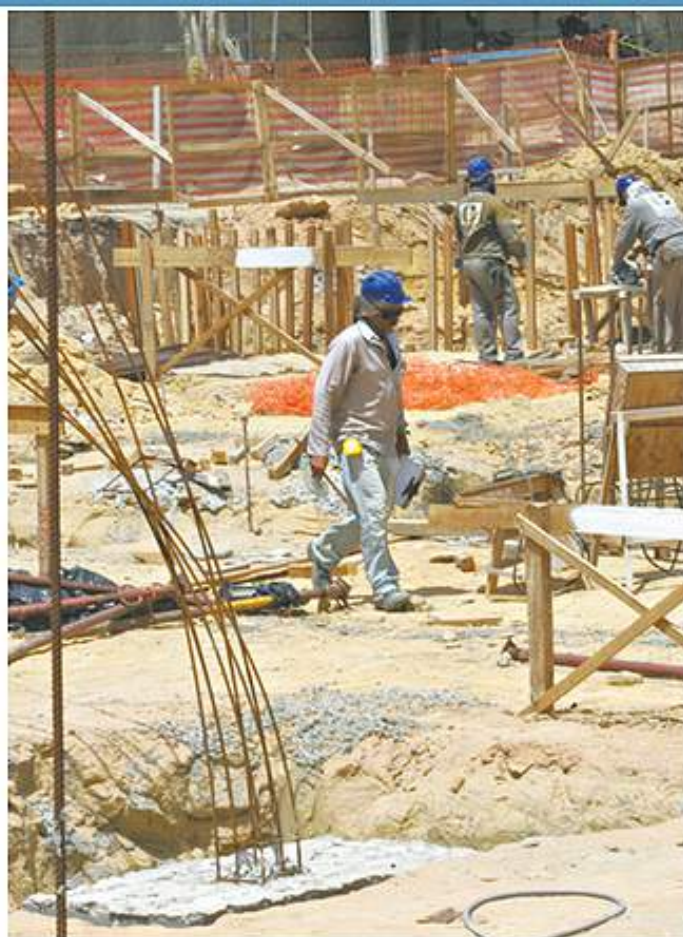
Em todo o Brasil, a construção civil vitimou cerca de 60 mil trabalhadores em 2014

O Ceará ficou com a 3ª posição no ranking de acidentes de trabalho no Nordeste, estando atrás apenas da Bahia e de Pernambuco, como aponta o último Anuário Estatístico da Previdência Social, com dados de 2014. De acordo com o levantamento, 13.315 trabalhadores cearenses se acidentaram neste período. Desse total, 60 morreram e 276 ficaram incapacitados de forma permanente para o trabalho.