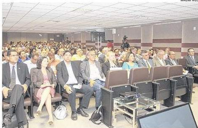
O Fórum Estadual de Saúde e Segurança no Trabalho aconteceu na manhã de ontem no TRT

As ações de prevenção, apesar de eficazes, muitas vezes só são implementadas após algum acidente. Segun-