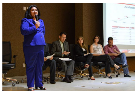
Audiência pública na Assembléia Legislativa do Estado do Ceará