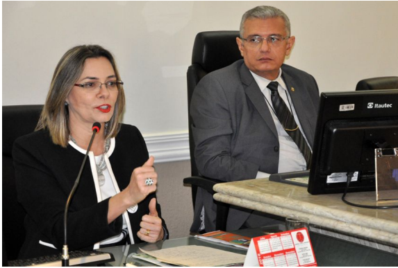
Encerramento da Semana na sala de sessões do TRT7