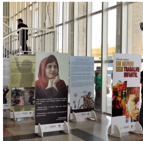
Fórum Autran Nunes e sede TRT7