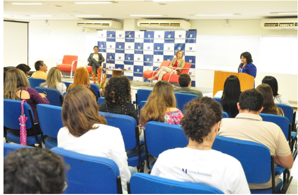
X Seminário do Escritório de Direitos Humanos - Centro Universitário Christus (Unichristus)