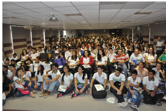
Palestras com estudantes de escolas profissionalizantes