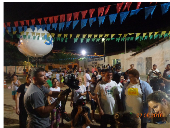
Arte na Praça - Programa Mais Infância Ceará