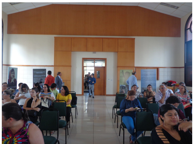
Seminário Estadual das Ações Estratégicas do Programa de Erradicação do Trabalho Infantil