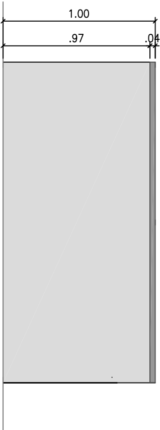
ELEVACAO 1 Esc. 1/25

OBSERVAÇÕES GERAIS: BALCÃO EM DIVISORIA TIPO FIBRAROC. PERFIL SIMPLES EM AÇO.