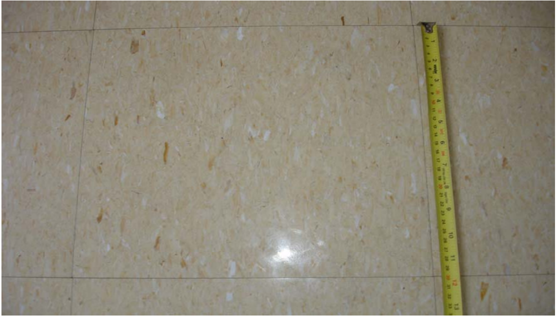
PLACA ISOVER(Lote 10)