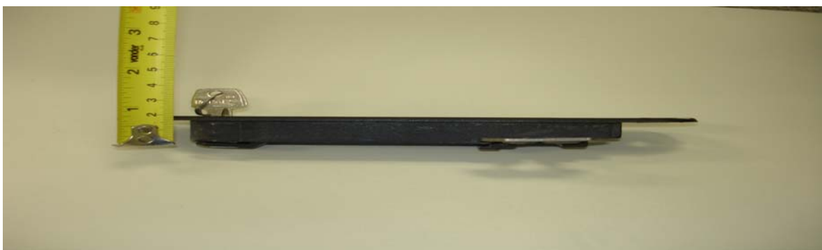
Kit comando DECA, linha Ravena, acionamento e vedação. (item 3, do lote 7).