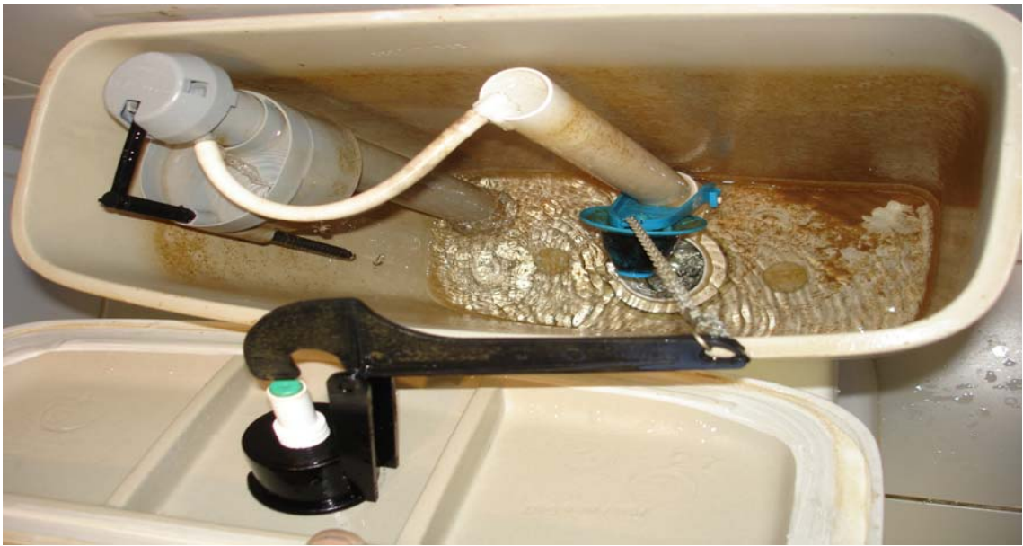
KIT CELITE peças de comando e vedação (lote 8)